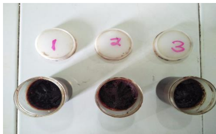
Gambar 2. Formulasi Krim Ekstrak Etanol Bawang Dayak

lebih mudah diaplikasikan dibandingkan dengan tipe A/M.