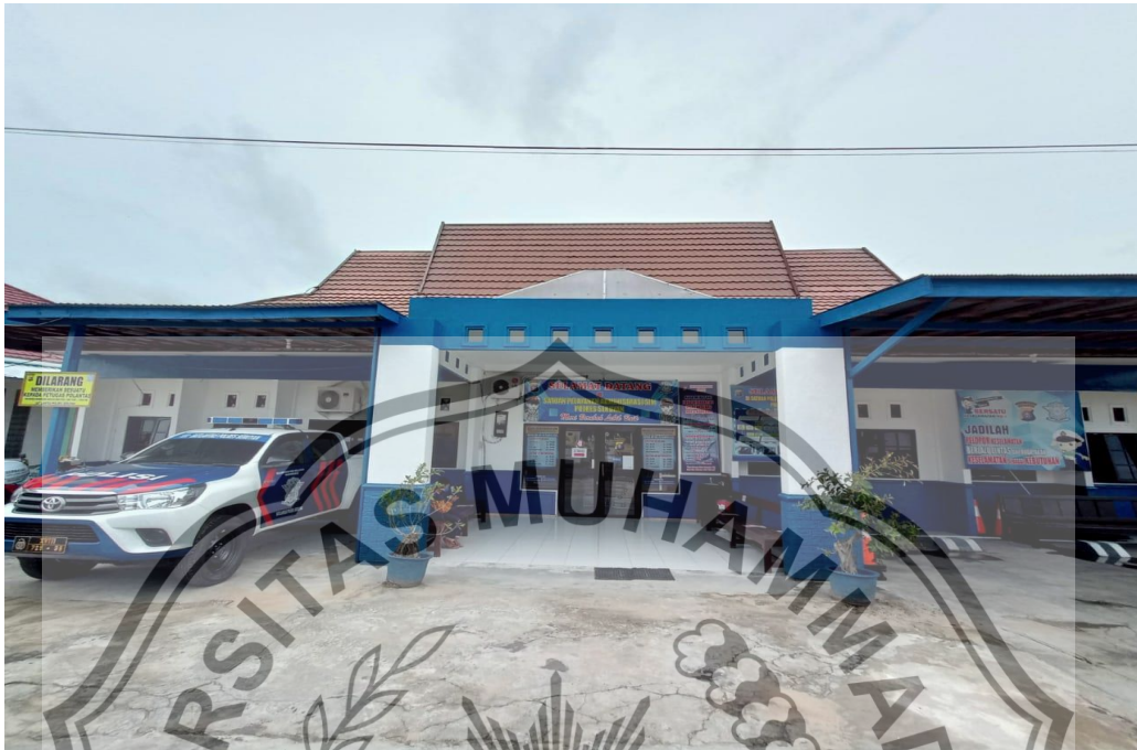
Kantor Satuan Lalu Lintas POLRES SERUYAN