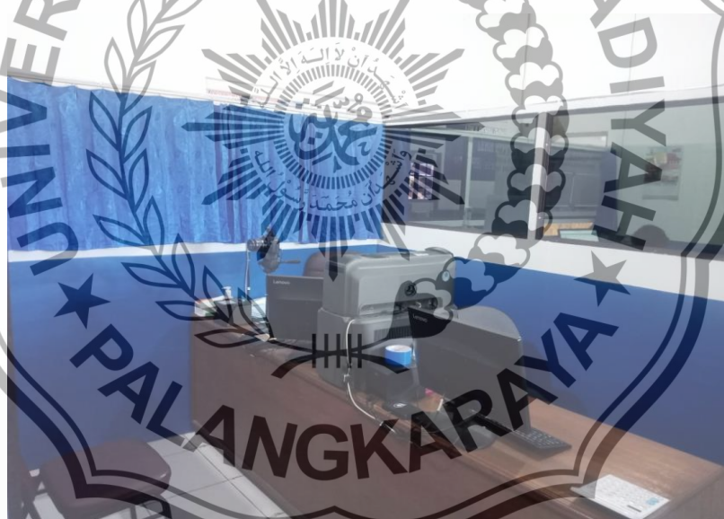
Ruang Entry ,Sidik jari dan Foto