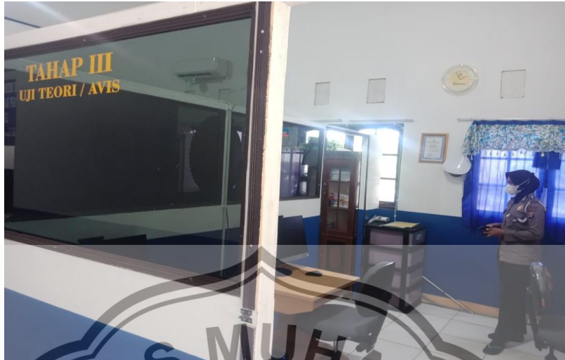
Ruang Teori Pemohon SIM