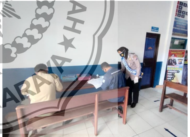
Meja Penulis Pemohon SIM