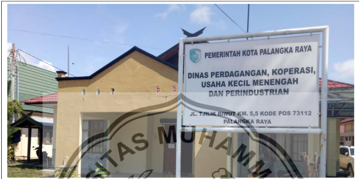
Tempat Penelitian : Dinas Perdagangan, Koperasi, Usaha Kecil Menengah dan Perindustrian Kota Palangka Raya