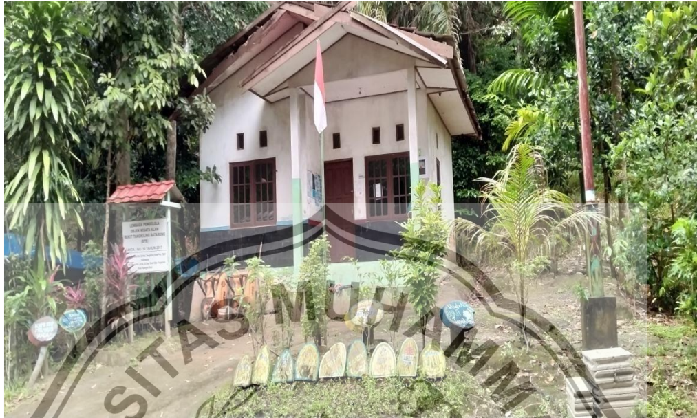
Pos Lembaga Pengelola Objek Wisata Alam Bukit Tangkiling Batarung