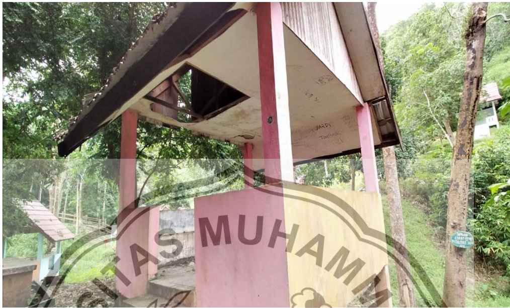
Gazebo yang rusak