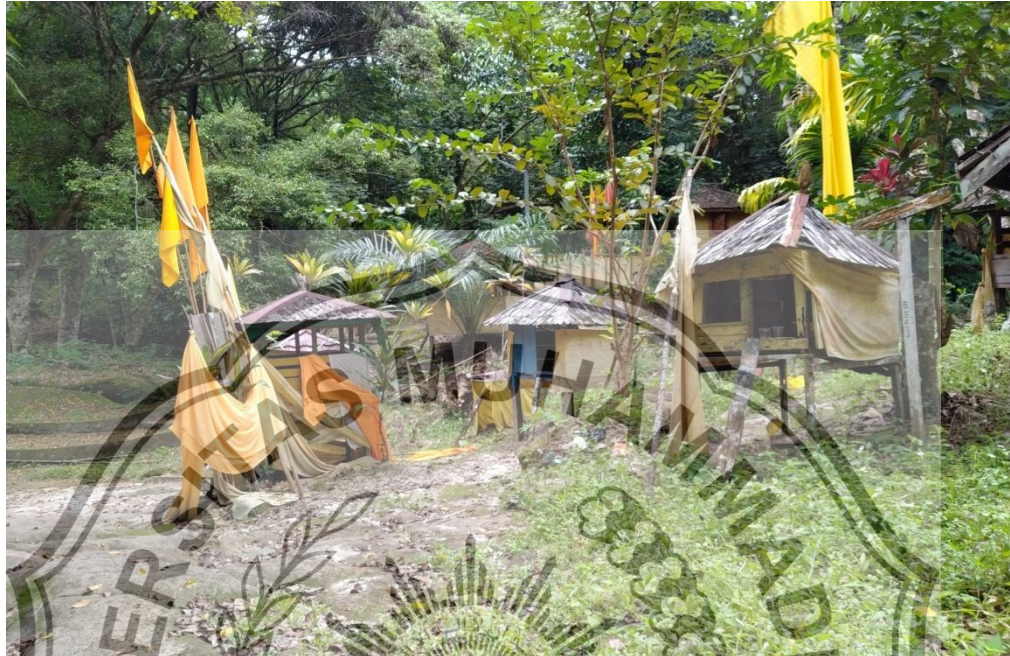
Daya Tarik Keramat