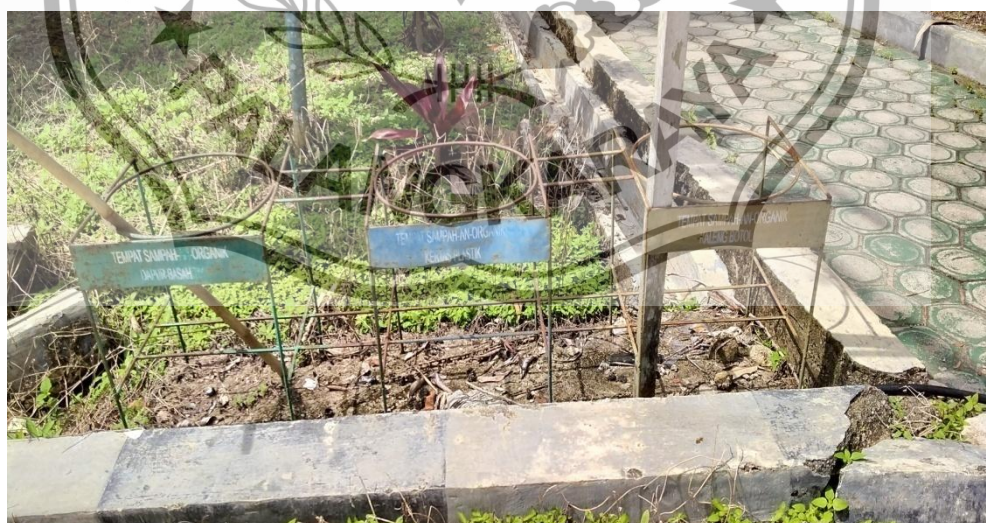
Tempat sampah yang tidak ada