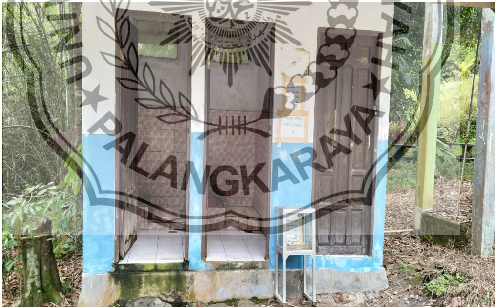
WC yang kurang terawat