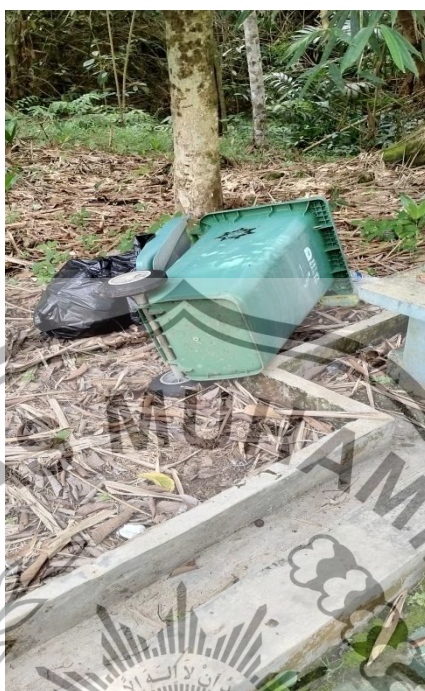
Tempat sampah yang rusak