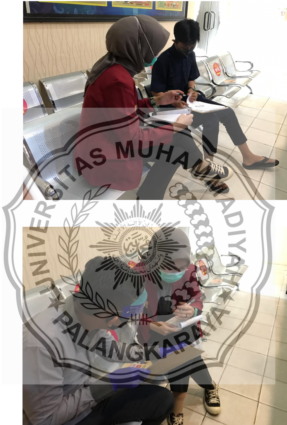
WAWANCARA DENGAN PEMOHON SKCK ONLINE DIT INTELKAM POLDA KALTENG