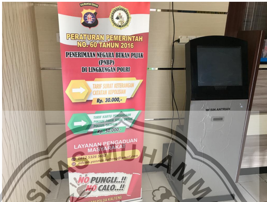
BANNER PNBP SKCK DAN MESIN ANTRI (FIFO)