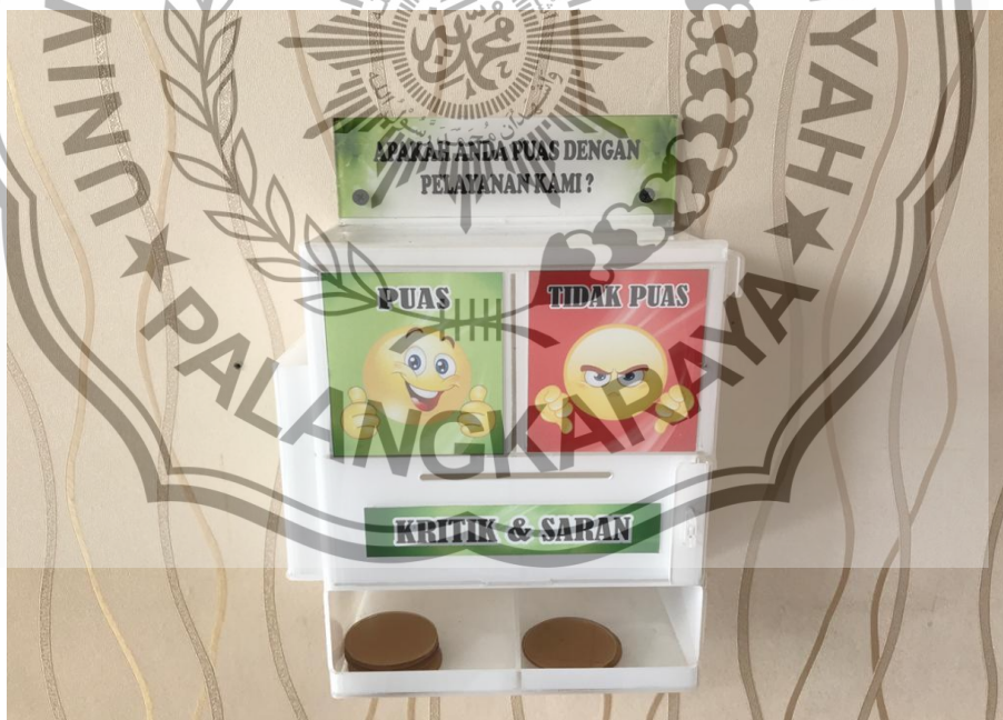
KOTAK SARAN SI YANMIN DIT INTELKAM POLDA KALTENG