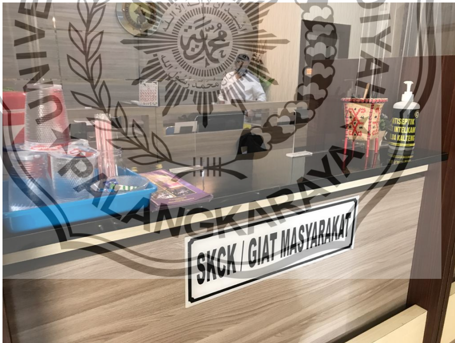
LOKET PELAYANAN SI YANMIN DIT INTELKAM POLDA KALTENG