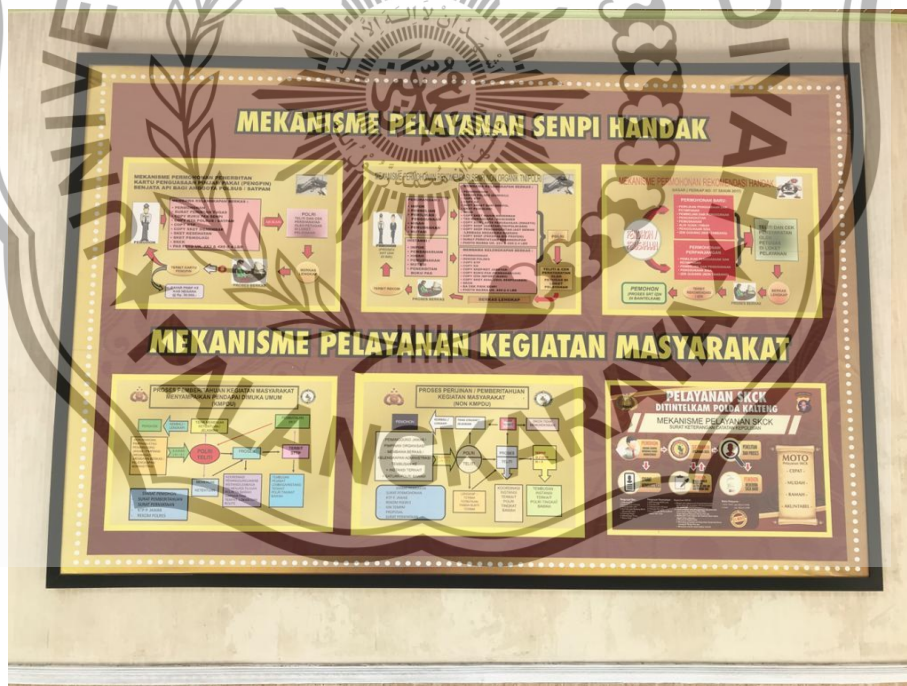
BANNER DAN SPANDUK MEKANISME PELAYANAN SKCK DAN SOP SAAT PANDEMI COVID 19