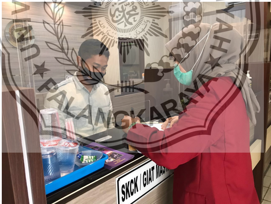
WAWANCARA DENGAN PETUGAS SKCK