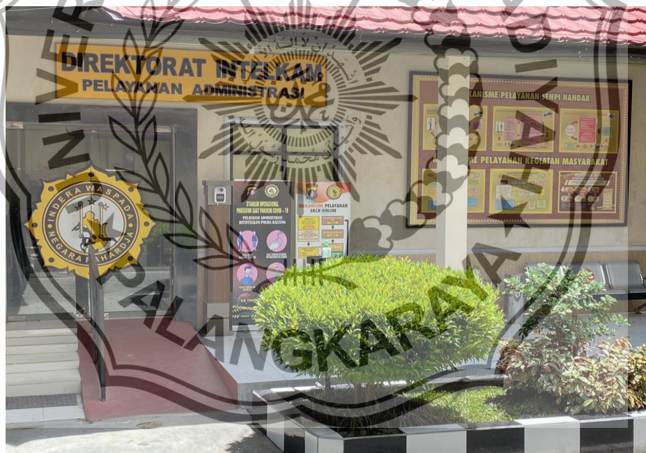
TAMPAK DEPAN RUANG PELAYANAN ADMINISTRASI DIT INTELKAM POLDA KALTENG