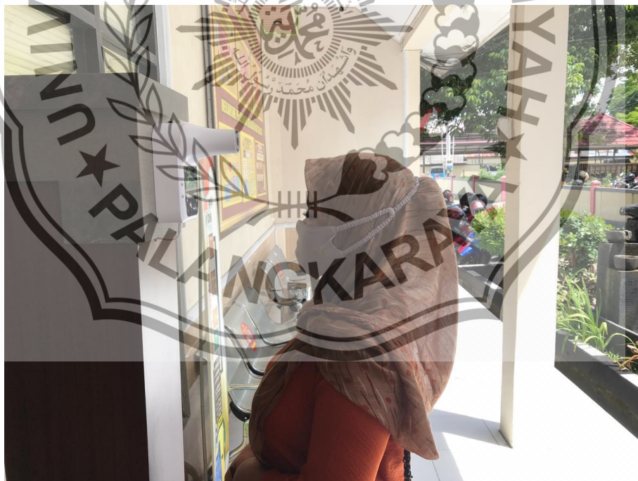
TEMPAT CUCI TANGAN DAN PENGUKUR SUHU OTOMATIS