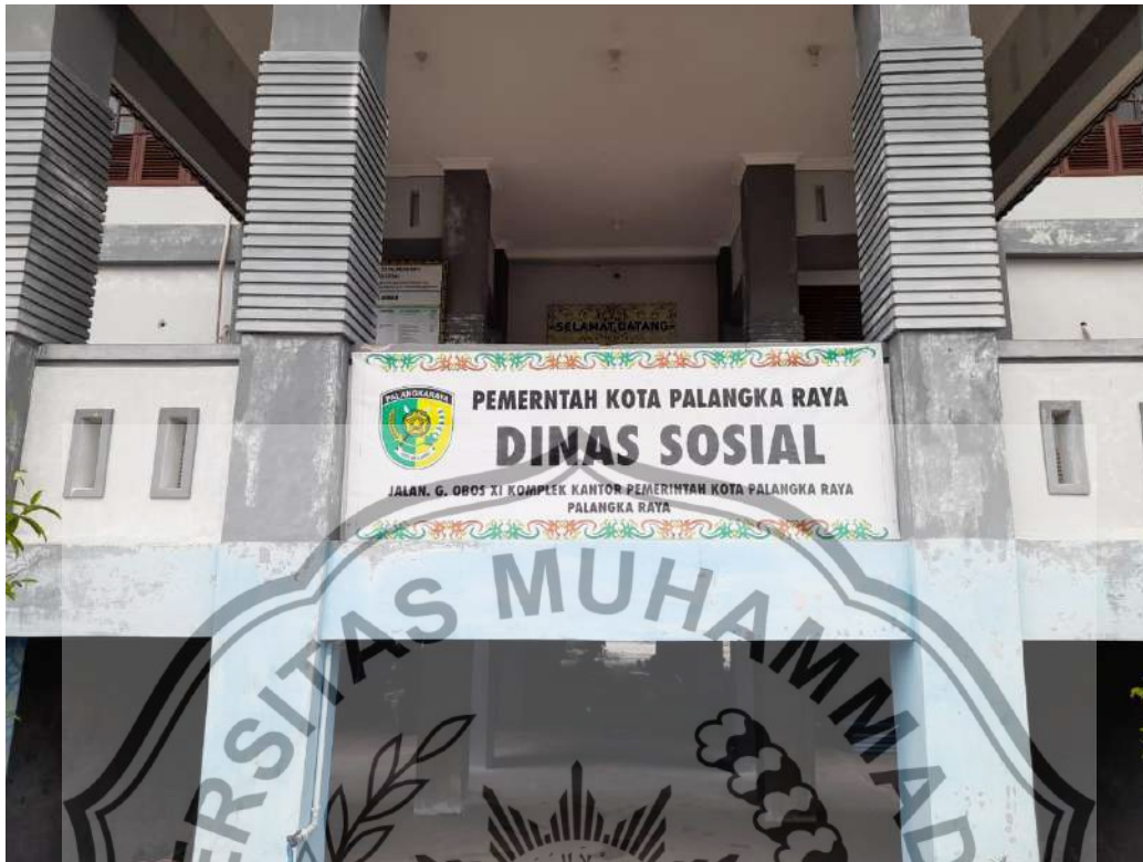
Papan Nama Dinas Sosial Kota Palangka Raya