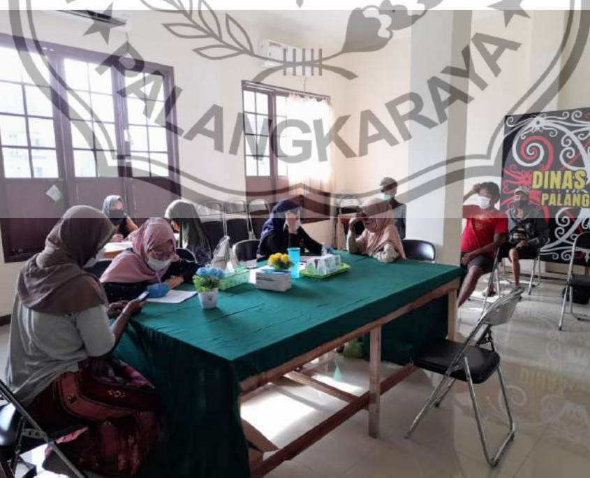
Saat pemeriksaan identitas para pengamen dan pengemis