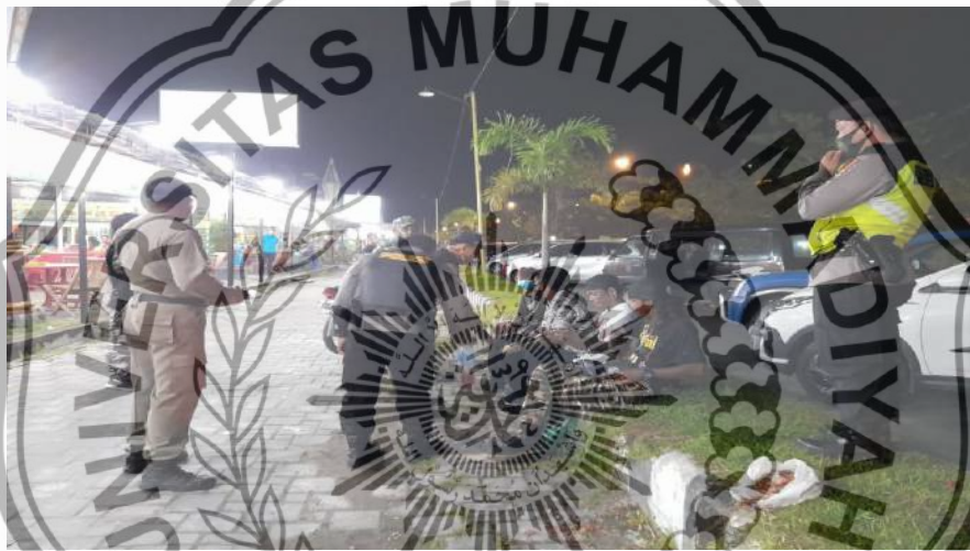
Penjemputan Para Pengamen di Taman Kuliner kota Palangka Raya