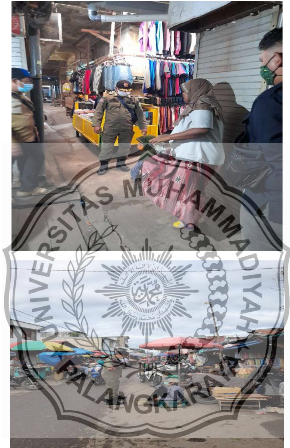
Penjemputan para pengemis dipasar besar untuk dibawa ke dinas sosial