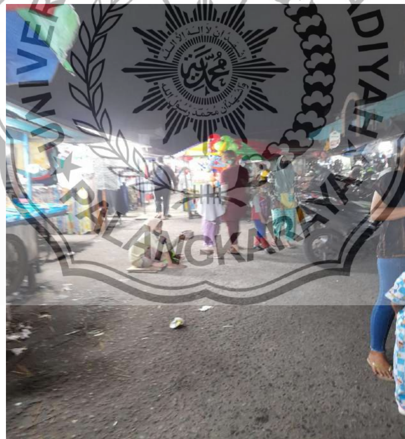
Para pengemis yang ada dipasar belauran Palangka Raya