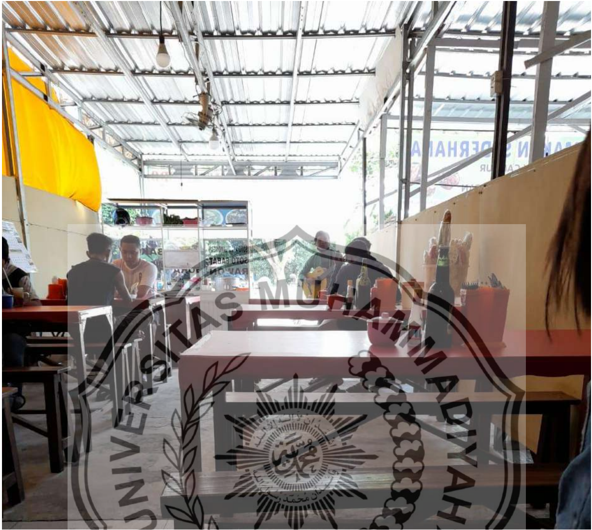
Pengamen di salah satu rumah makan di Jalan Yos Sudarso