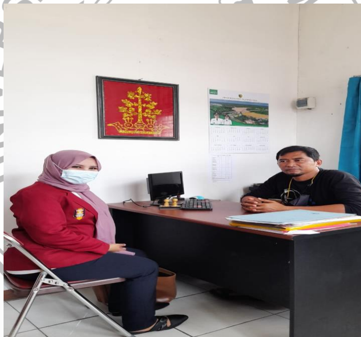
Wawancara bersama Sekretaris Lurah Kelurahan Panarung Kecamatan Pahandut