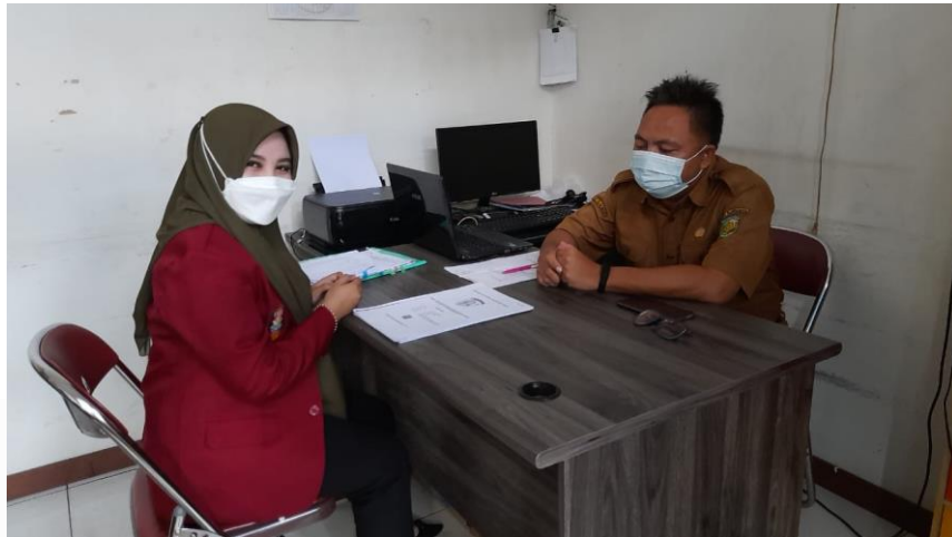
Wawancara bersama Kasi Pemerintahan Keamanan dan Ketertiban Kelurahan Panarung Kecamatan Pahandut