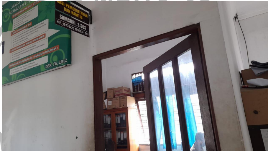
Ruang Kepala dan Staff Seksi Pemerintahan, Keamanan dan Ketertiban Kelurahan Panarung Kecamatan Pahandut