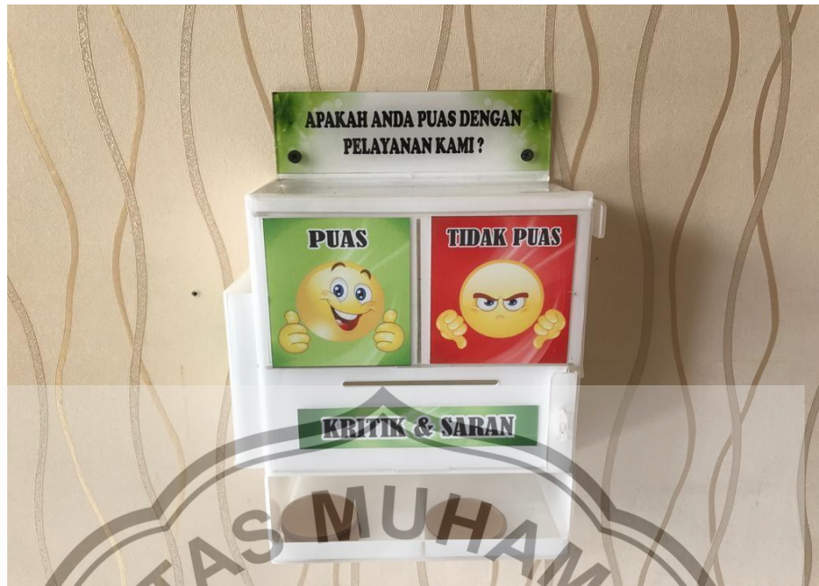
KOTAK SARAN SI YANMIN DIT INTELKAM POLDA KALTENG