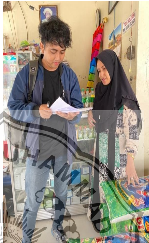
4 . Wawancara dengan Ibu R