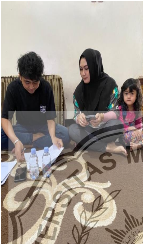
3 . Wawancara dengan Ibu D