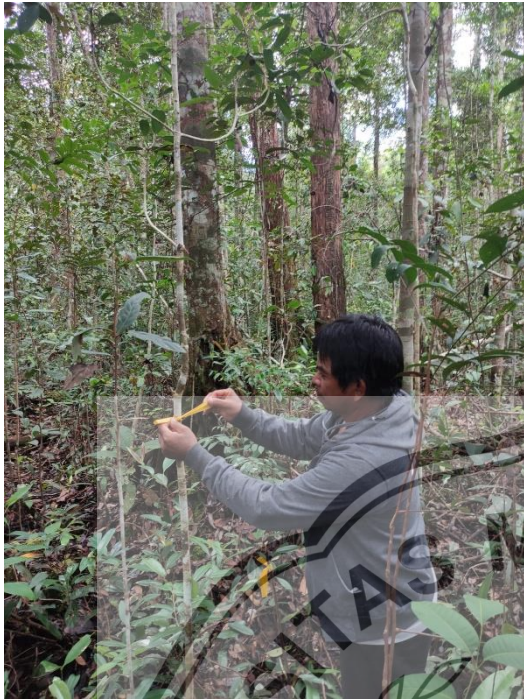
Pemasangan tanda plot