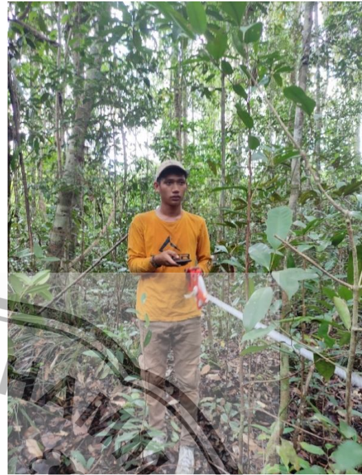
Penentuan arah plot