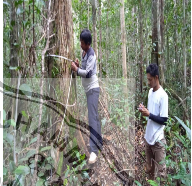
(Pencatatan data dilapangan)