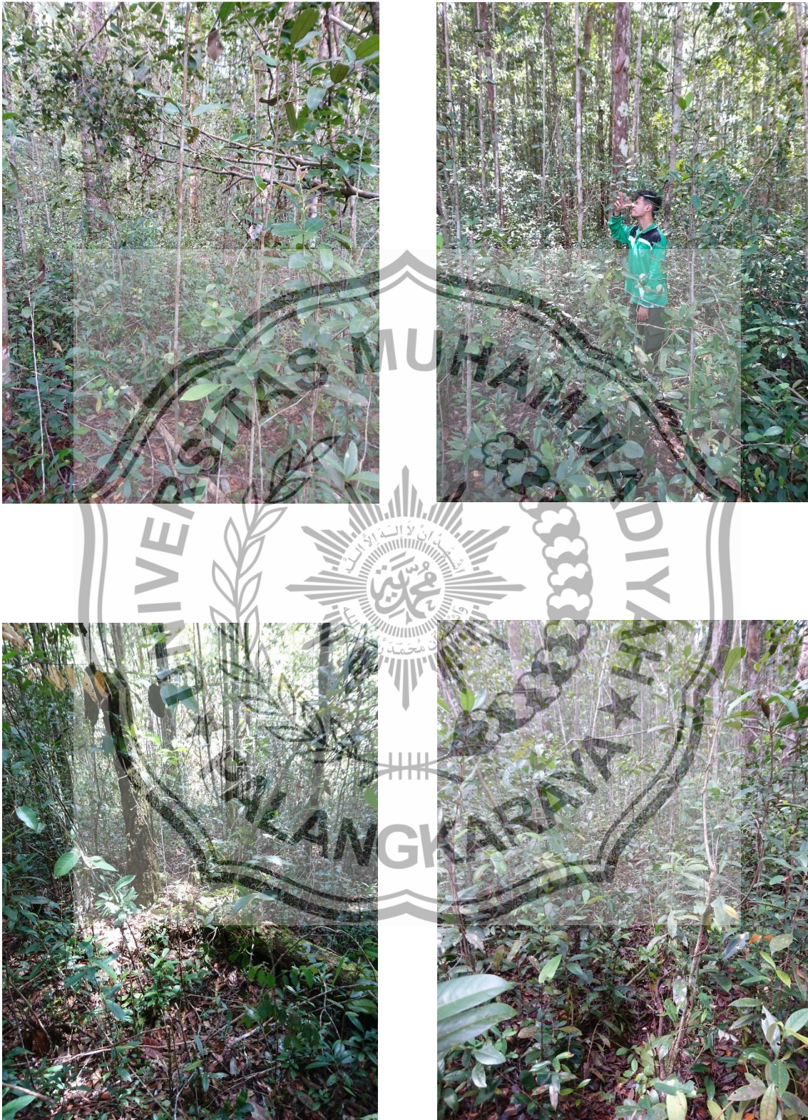
Kondisi umum lokasi penelitian