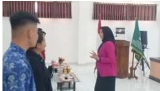
Foto Kegiatan Pelatihan

Pengetahuan bagi mahasiswa tidak hanya teori dan diskusi tetapi juga dalam bentuk praktik secara langsung tentang bagaimana teknik maupun strategi yang baik dalam berkomunikasi agar nantinya dapat menjadi Pendharmawacana yang handal dan profesional dalam penyebaran pemahaman ajaran agama Hindu kedepannya. Strategi komunikasi. Strategi komunikasi dalam penyampaian pesan-pesan yang terdapat pada