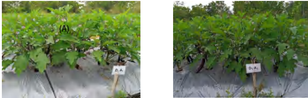
Gambar 1. Kondisi tanaman terong ungu pada kombinasi perlakuan kapur dolomit 7 t ha -1 dengan pupuk kandang ayam 20 t ha -1 (A) dan kapur dolomit 11 t ha -1 dengan pupuk kandang ayam 40 t ha -1 (B) di tanah berpasir

Tingkat kemanisan buah terong ungu diperoleh dengan mengukur cairan segar buah menggunakan refractometer . Hasil penelitian menunjukkan bahwa tanaman terong ungu yang diberikan perlakuan kapur dolomit maupun pupuk kandang ayam memiliki tingkat kemanisan buah yang sama. Tingkat kemanisan buah terong ungu tersebut masih dalam kisaran 3.32–3.75 °Brix yang masih tergolong rendah ( poor ), sedangkan kemanisan buah terong yang baik ( good ) harus mempunyai tingkat kemanisan mencapai 8 °Brix ( Indonesia Customs and Excise Laboratory , 2016).