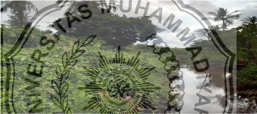
Foto Dok.2. Pembangunan jalan yang tidak memanfaatkan