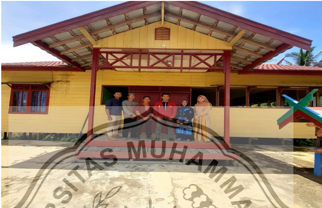
Foto Dokumentasi 1. Pemerintah Desa Selat baning bersama peneliti