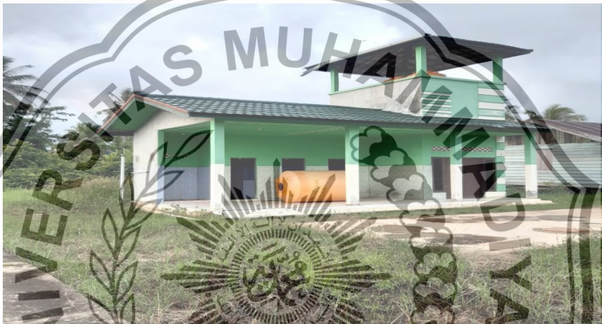
Foto Dok 2. Produk Pembangunan tanpa papan informasi