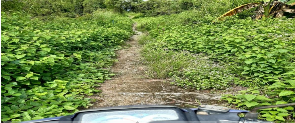
Foto Dok 2 jalan desa yang tidak dilakukan pemeliharaan