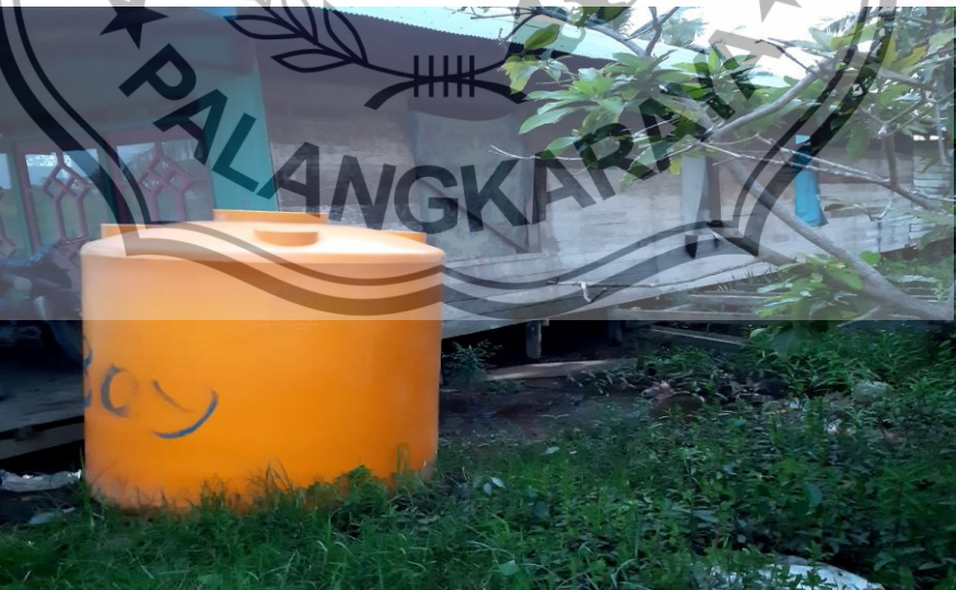
Foto Dok 2. Tandor air yang tidak dimanfaatkan