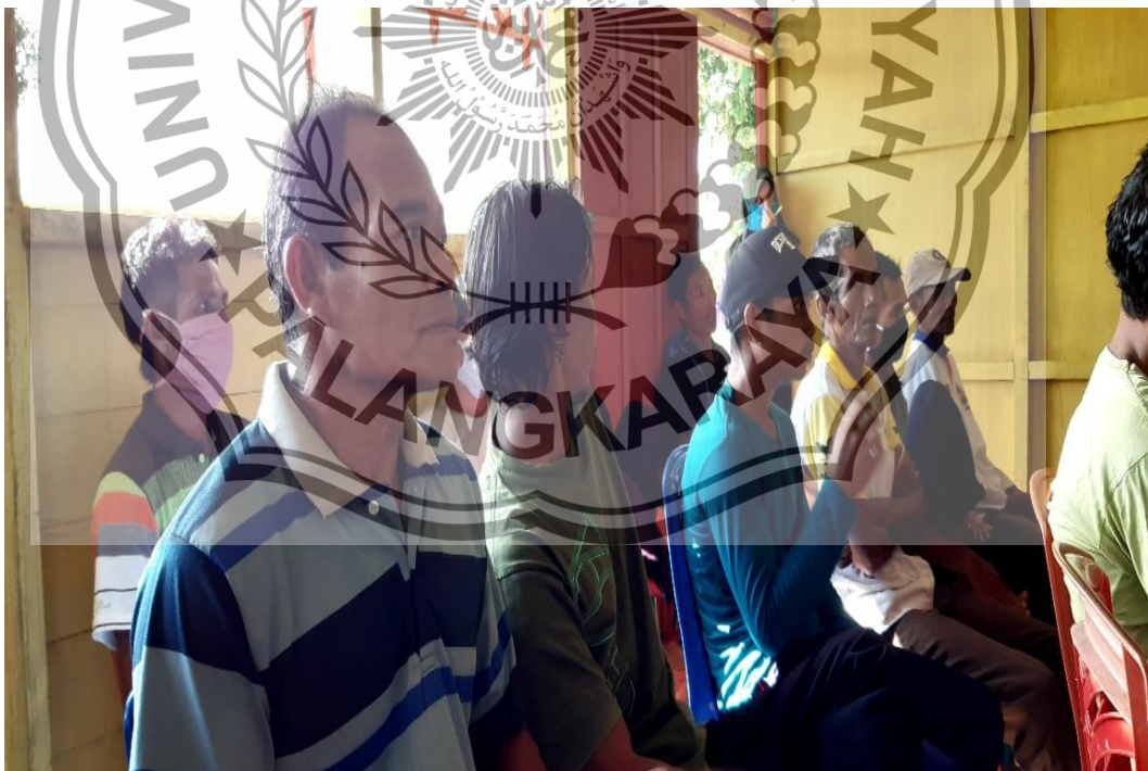
Foto Dokumentasi 1. Masyarakat bersama peneliti