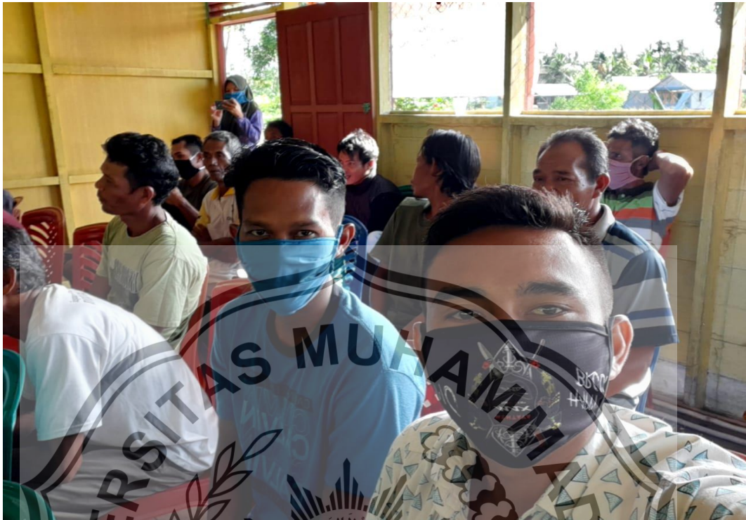
Foto Dokumentasi 1. Masyarakat bersama peneliti