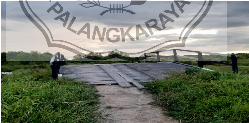
Foto Dok 2. Produk Pembangunan tanpa papan informasi