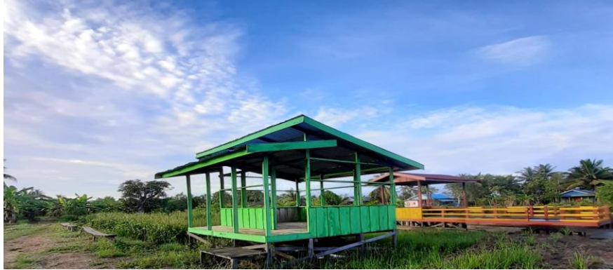
Foto Dok 2. Produk Pembangunan tanpa papan informasi