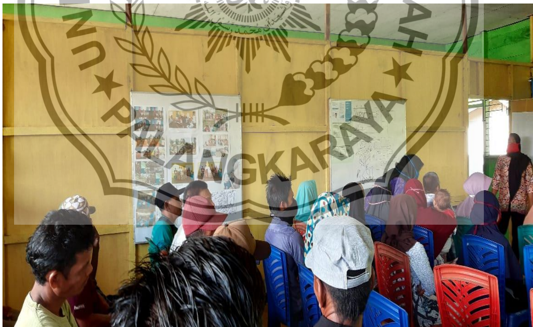
Foto Dokumentasi 1. Masyarakat sebagian sedang mengikuti kegiatan