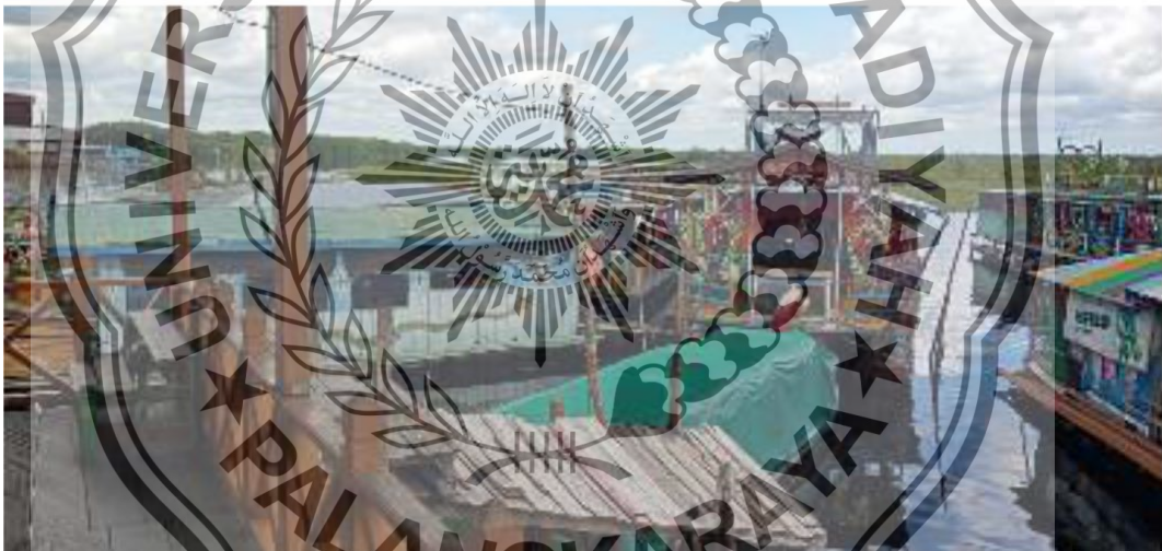
Suasana Objek Wisata Dermaga Kereng Bangkirai