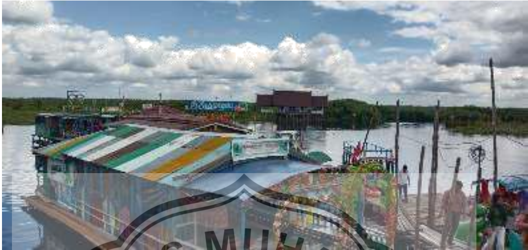
Suasana Pada Saat Pengunjung Selesai Susur Sungai