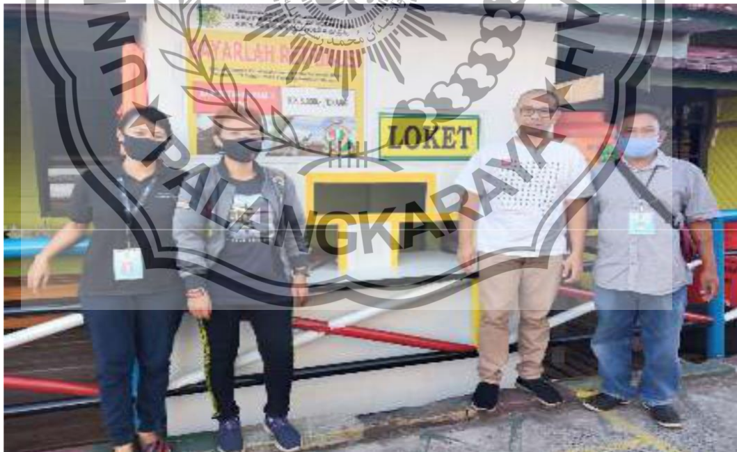
Foto tempat loket tiket masuk objek wisata Dermaga Kereng Bangkirai