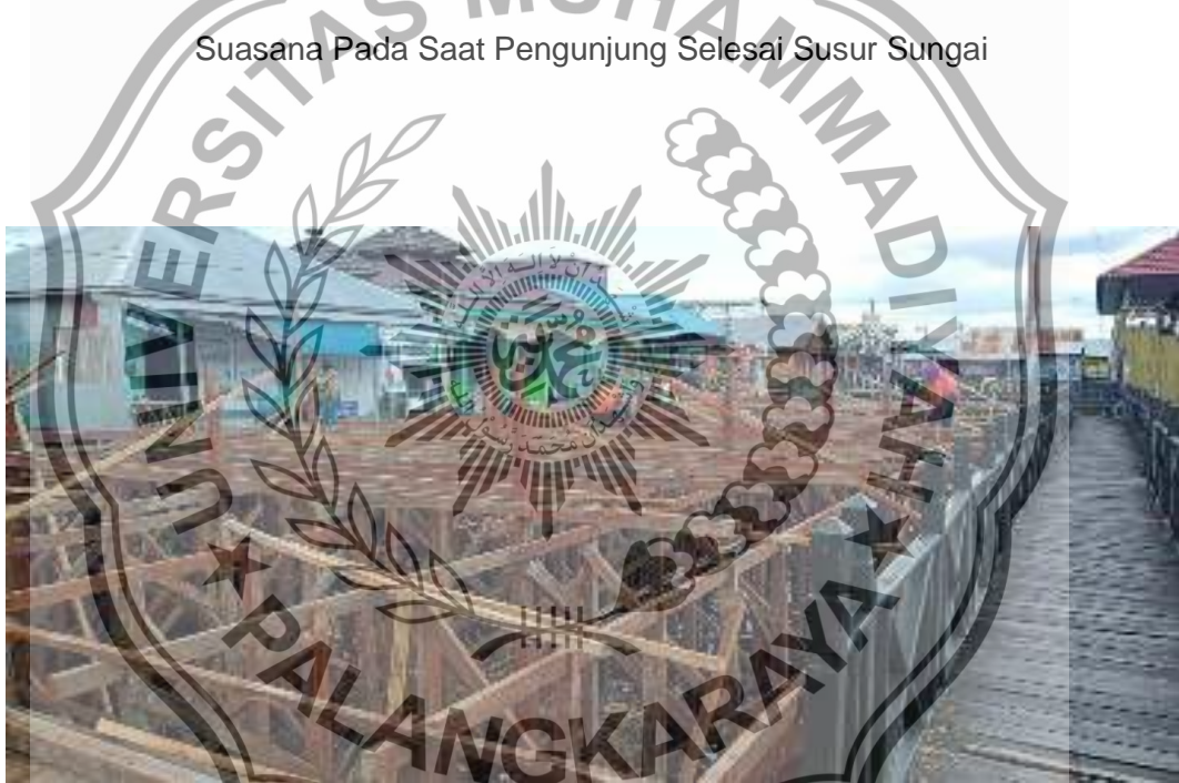
Pembangunan Penambahan Fasilitas Yang Ada Di Objek Dermaga Wisata Kereng Bangkirai