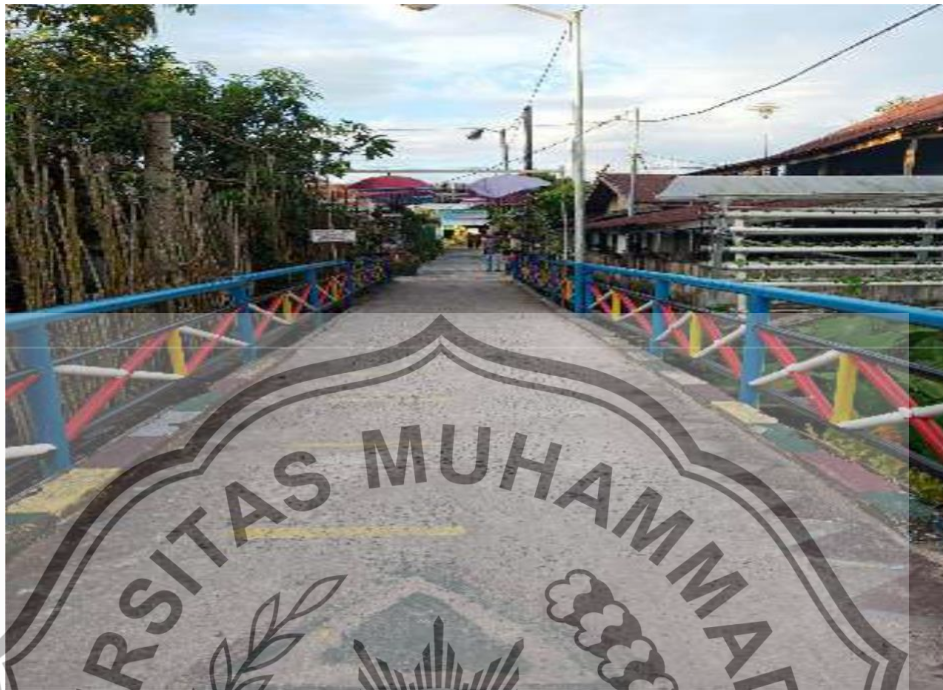
Foto jalan masuk ke objek wisata Dermaga Kereng Bangkirai