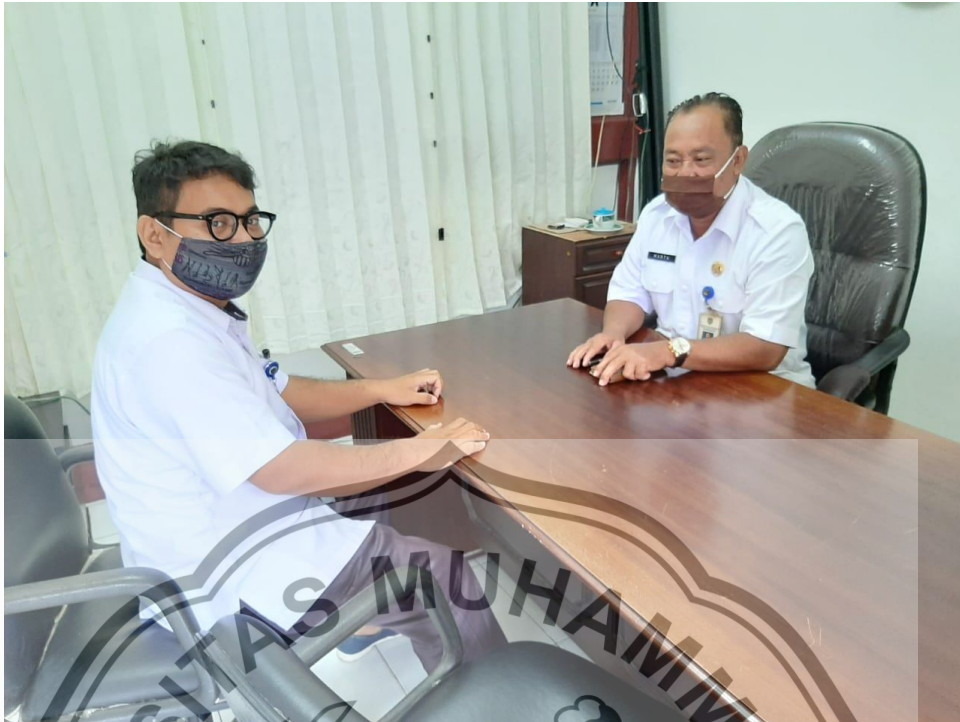
Wawancara dengan Sekretaris BKPSDM Kabupaten Seruyan