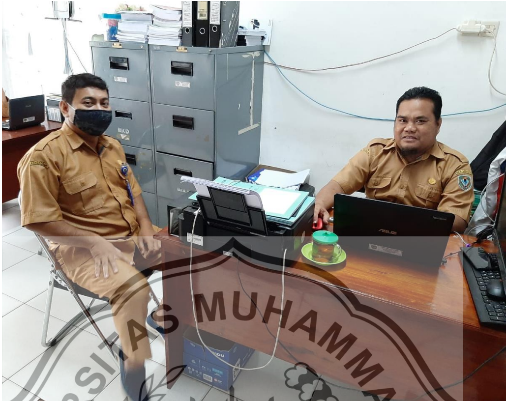
Wawancara dengan Pengurus Barang BKPSDM Kabupaten Seruyan