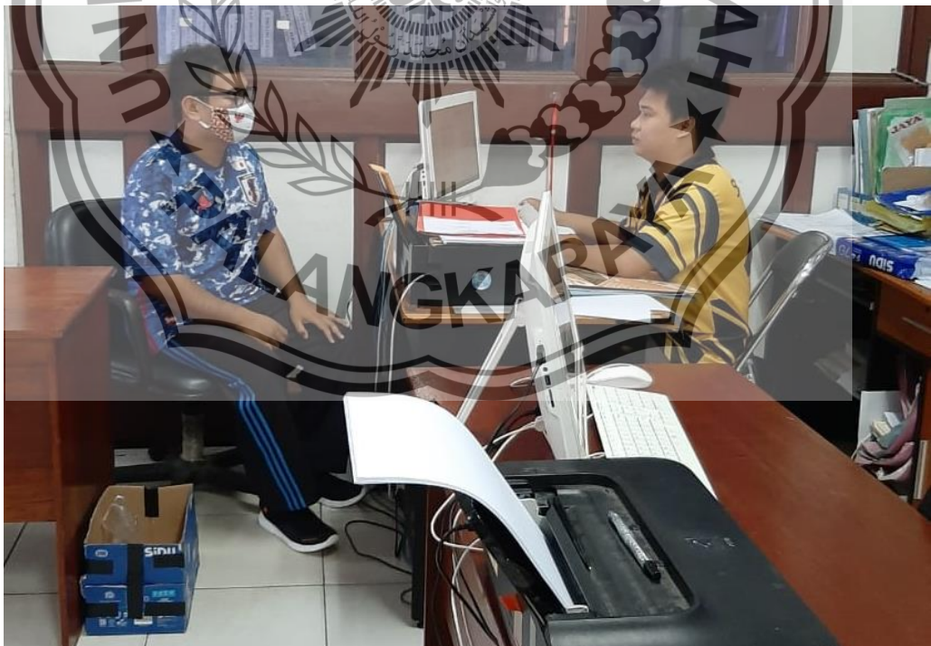
Wawancara dengan Staf/Operator SIMPEG