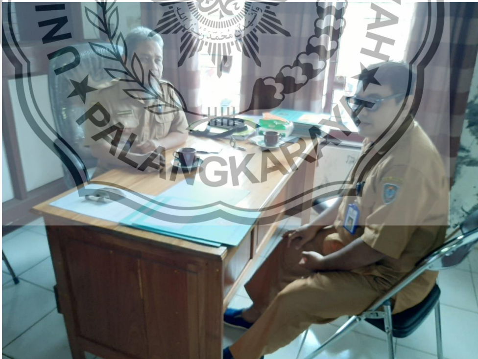
Wawancara dengan Kepala Bidang Pengembangan Kompetensi