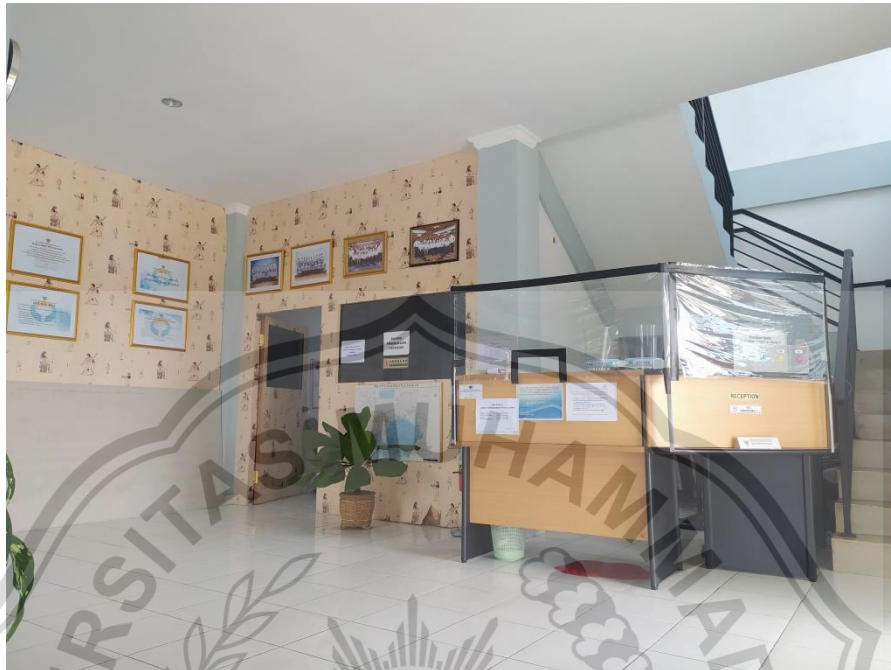
KANTOR OMBUDSMAN RI PERWAKILAN KALIMANTAN TENGAH