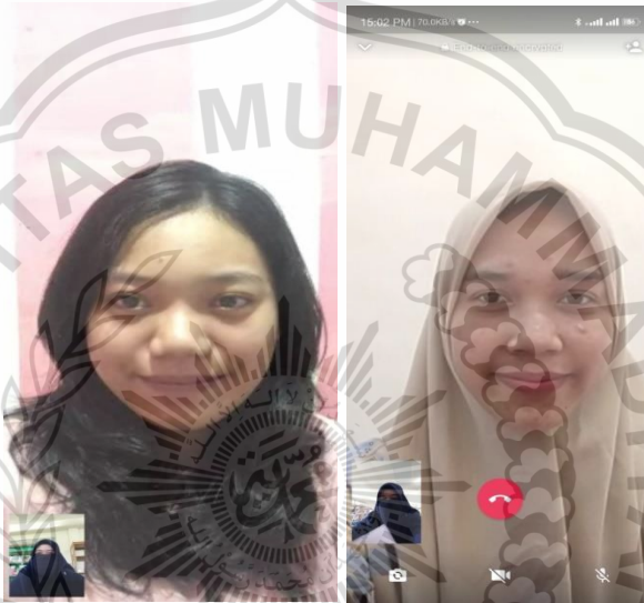
Wawancara dengan masyarakat via WhatsApp (Video Call)