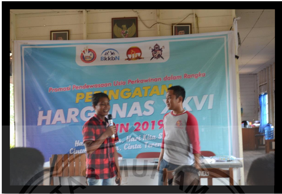
(Promosi Pendewasaan Usia Perkawinan di Tumbang Rungan)