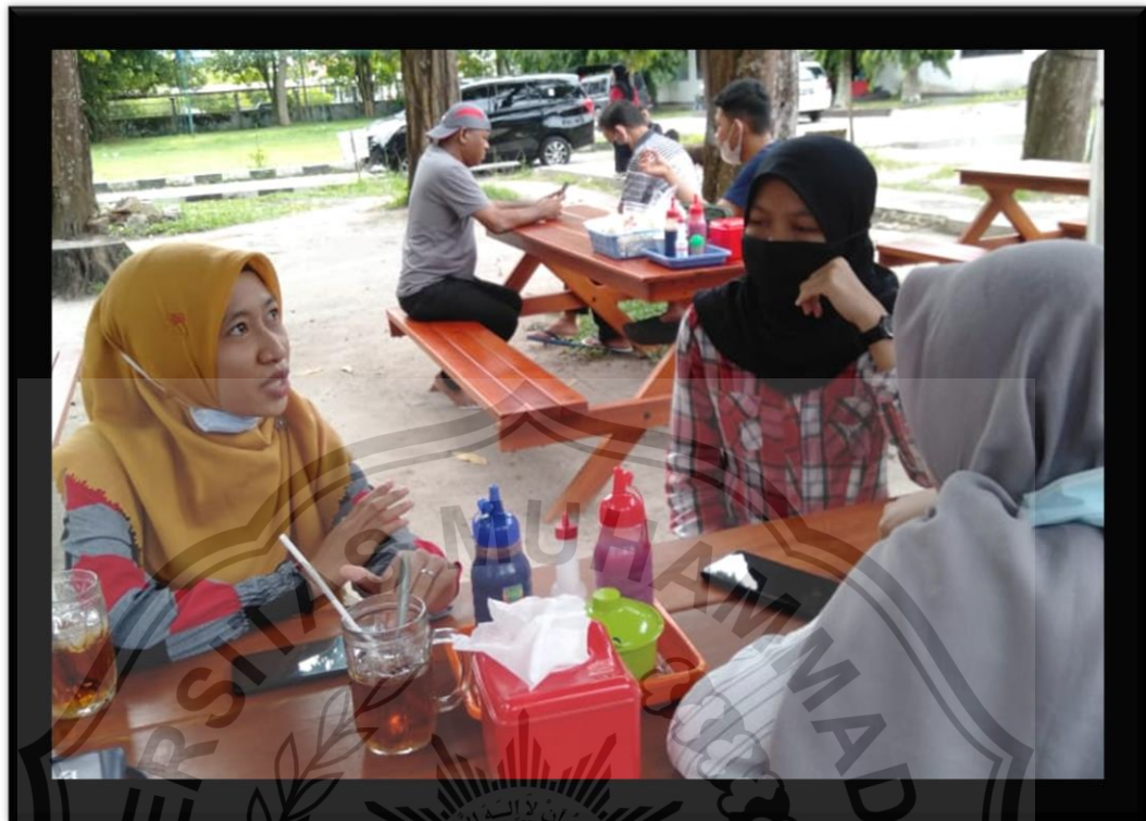
(Penulis saat Wawancara bersama Pendidik Sepaya)