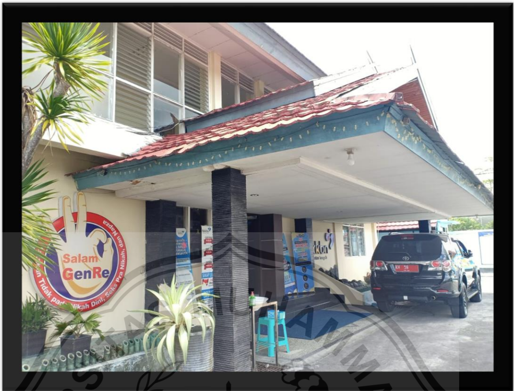
(Kantor BKKBN Provinsi Kalimantan Tengah)