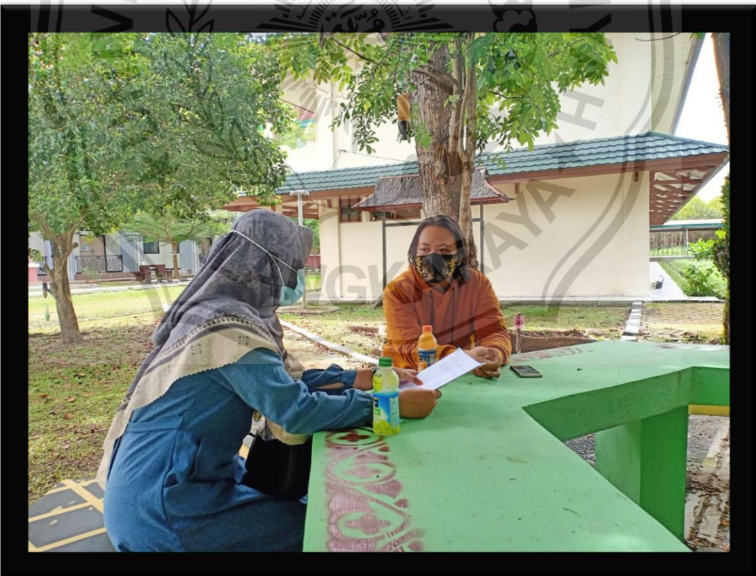
(Penulis saat Wawancara bersama pengurus Forum Genre Provinsi Kalimantan Tengah)