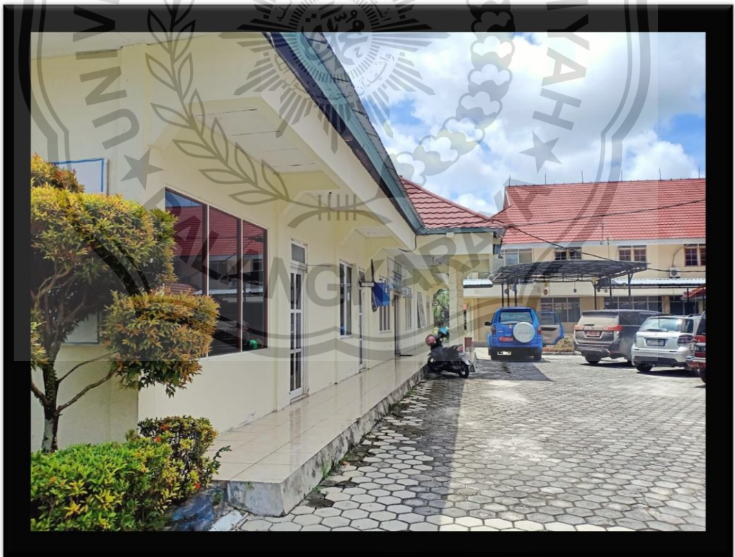
(Kantor BKKBN Provinsi Kalimantan Tengah)