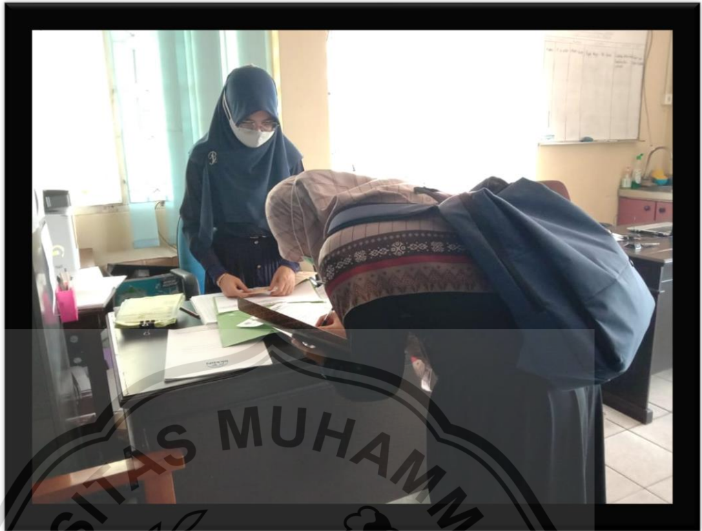
(Pengantaran Surat Penelitian di BKKBN Provinsi Kalimantan Tengah)