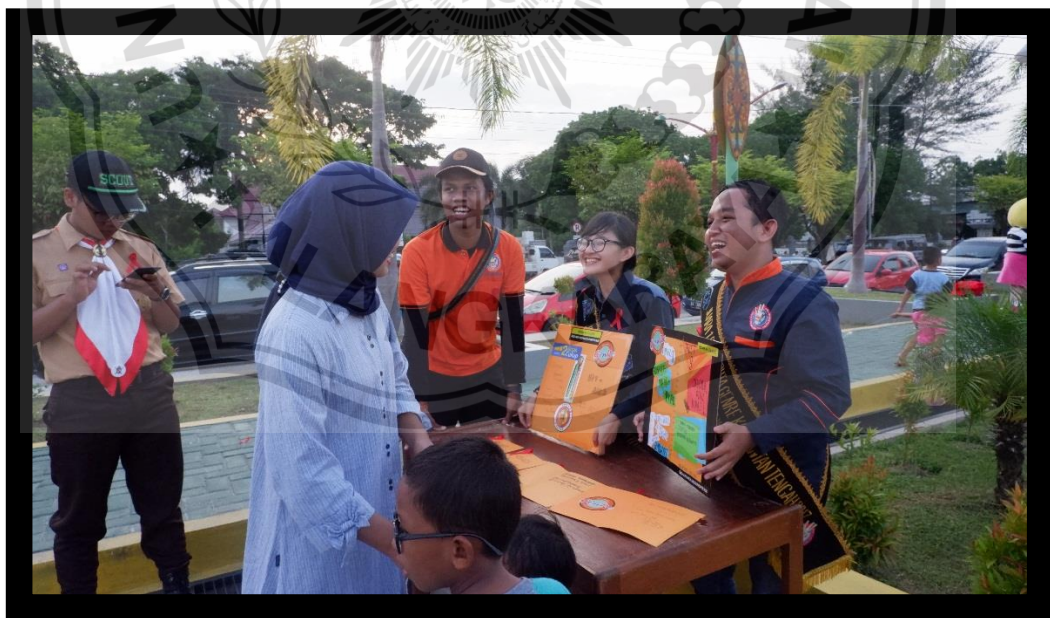
(Forum GENERE KALTENG saat Sosialisasi Kepada Masyarakat)