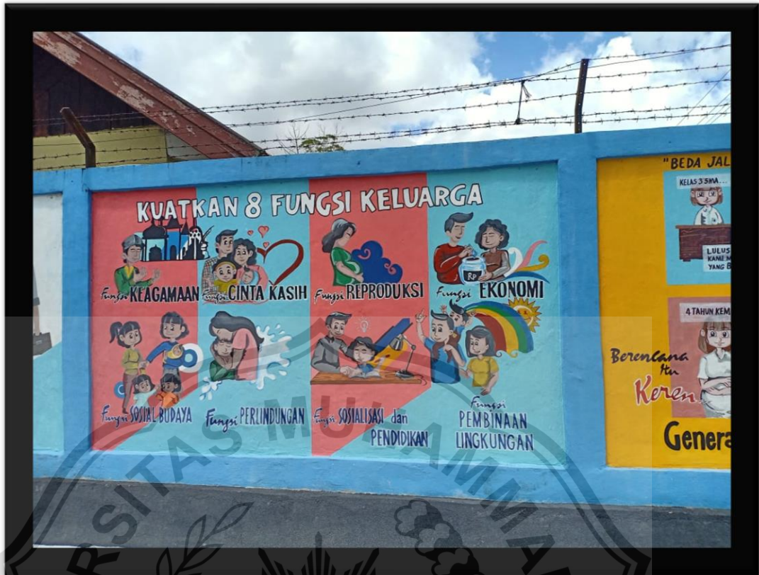
(Kantor BKKBN Provinsi Kalimantan Tengah)