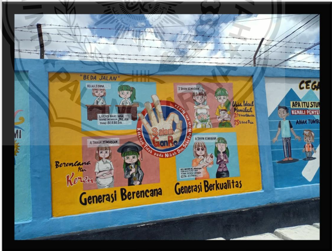
(Kantor BKKBN Provinsi Kalimantan Tengah)