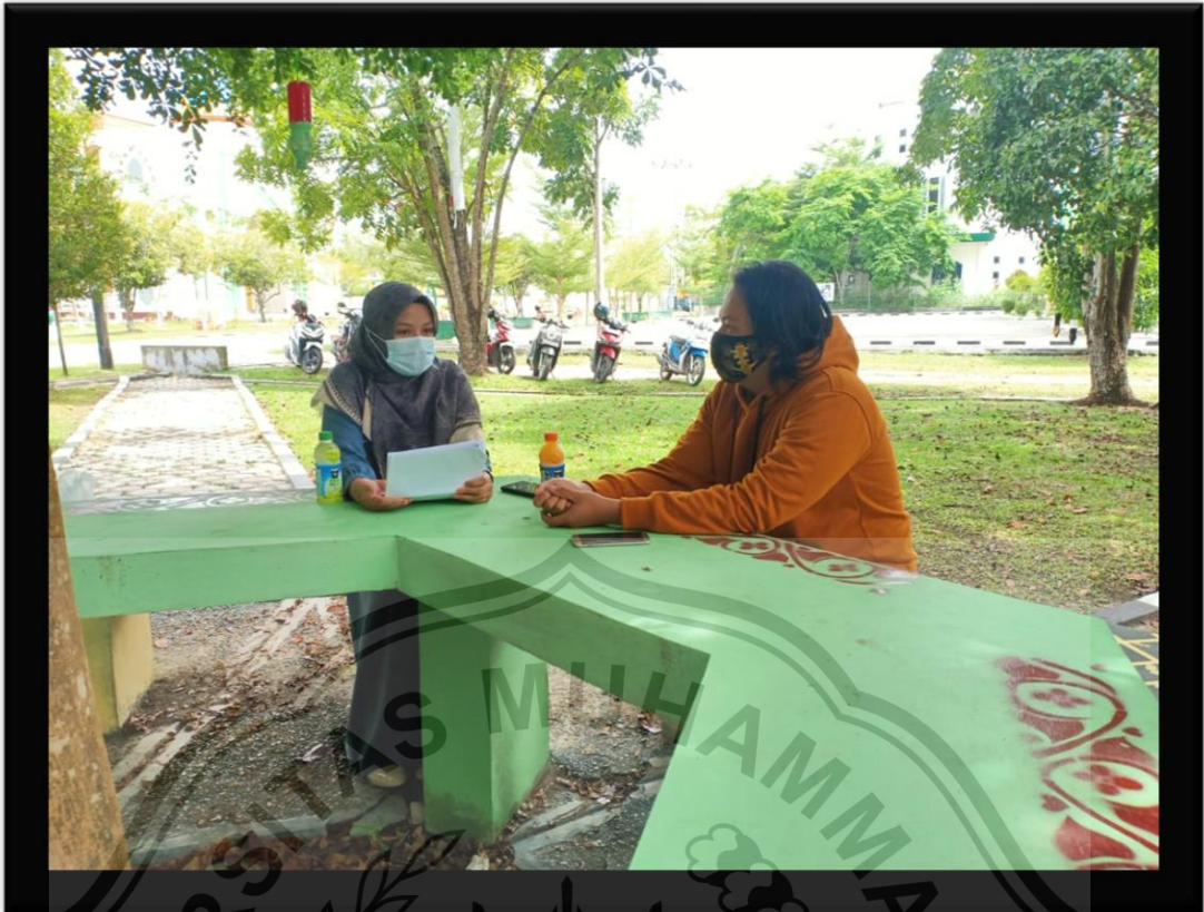
(Penulis saat Wawancara bersama pengurus Forum Genre Provinsi Kalimantan Tengah)