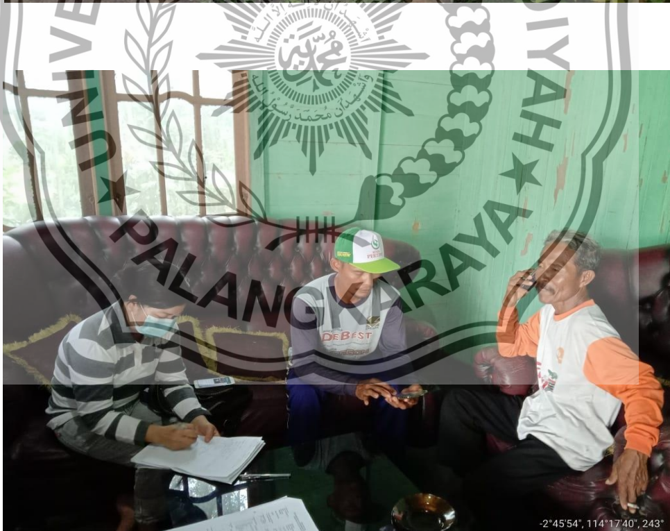
Dokumentasi. Wawancara dengan Kelompok Tani Budi Murni