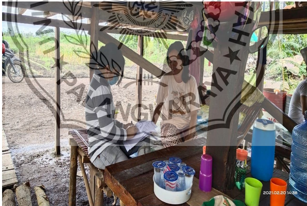
Dokumentasi. Wawancara dengan Anggota Kelompok Tani Tunas Muda Bereng