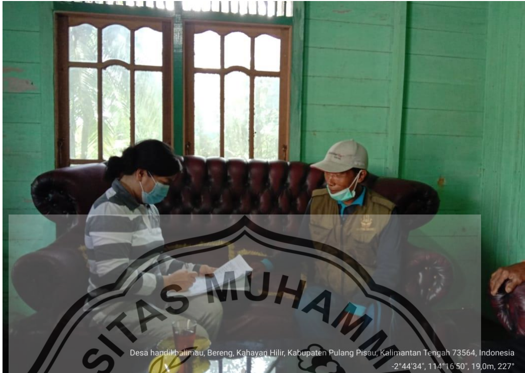
Dokumentasi. Wawancara dengan ketua Kelompok Tani Usaha Bersama